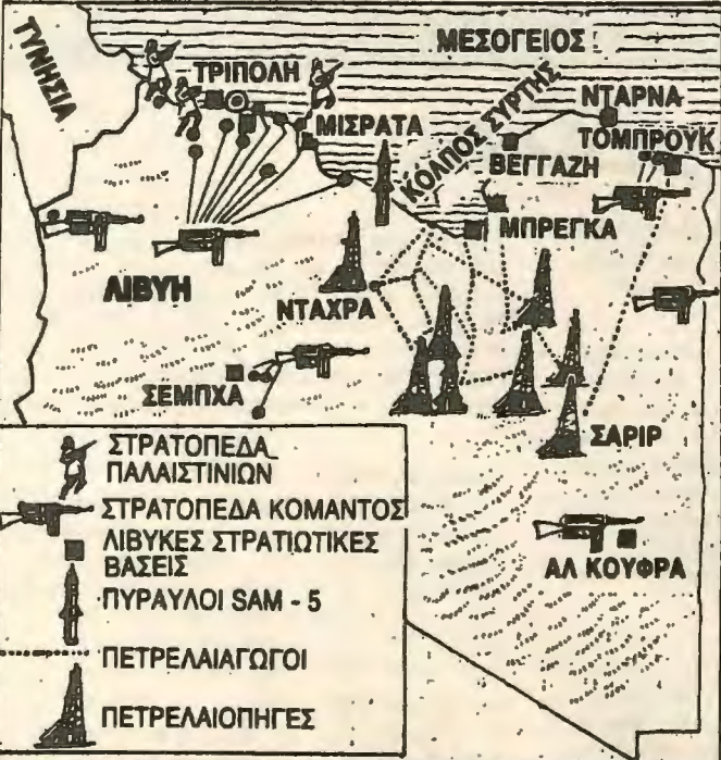
Χάρτης της Λιβύης με τις πετρελαιοπηγές και τους στρατιωτικούς στόχους

μορφωμένα με πιο έντονη στρατιωτική δράση τύπου Ρώμης και Βιέννης, αντι για αναπροσανατολισμό στις μεθόδους της μαζικής δουλειάς στις κατεχόμενες περιοχές, στην Ανατολική όχθη, και μέσα στο ίδιο το Ισραήλ. Κανένας Ισραηλινός εργάτης δεν μπορεί να υπο-